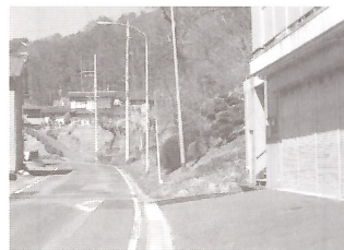
（写真4）白百合学園入口付近の急傾斜地