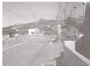
（写真3）急カーブ危険箇所の桜ヶ丘団地前交差点