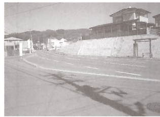
（写真2）市単独事業で一部道路整備した山岸三、四丁目地内バス停周辺