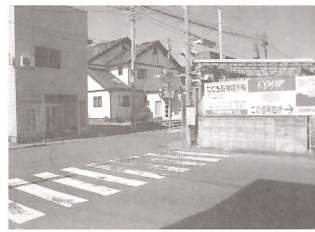
（写真1）学童通学路で最も危険な山岸小学校入口交差点

こうした取り組みによって、17m幅員の提案は13m幅員に圧縮され、大方の町内のご理解を得ることができました。